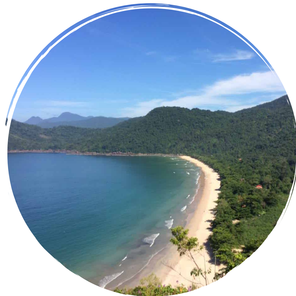
Praia do Sono